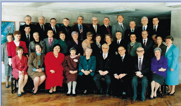
Научный центр акушерства, гинекологии и перинатологии РАМН, 1990 г.