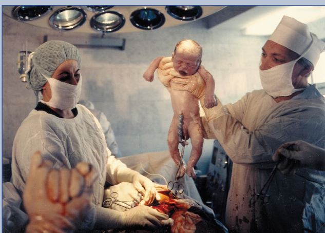
Первый ребенок «из пробирки», 1986 г.