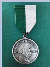
Медаль Альберта Швейцера Европейской академии естественных наук.