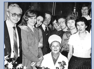
Сотрудники Московского областного научно-исследовательского института акушерства и гинекологии.