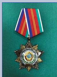
Орден Дружбы народов 1981 г.