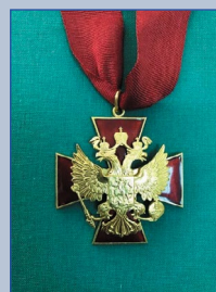
Орден «За заслуги перед Отечеством» III степени 2000 г.