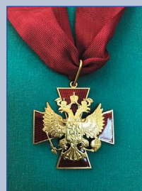
Орден «За заслуги перед Отечеством» II степени 2004 г.