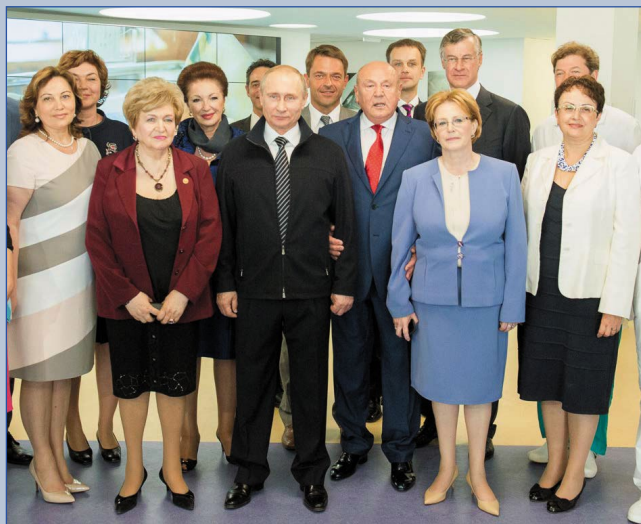
В.В. Путин на открытии Федерального перинатального центра.

сообщал кто-то из первых увидевших его, и сотрудники торопились выйти из кабинетов, чтобы успеть поздороваться с ним.