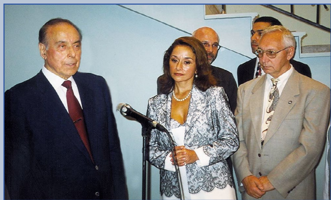
С президентом Республики Азербайджан Гейдаром Алиевым и актрисой Лейлой Шихлинской, 1999 г.