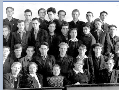
9-й класс Московской средней общеобразовательной школы №241, 1954 г.