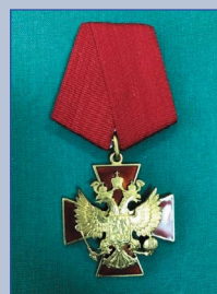
Орден «За заслуги перед Отечеством» IV степени 1997 г.