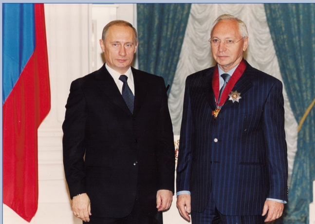
С президентом России В.В. Путиным после вручения ордена «За заслуги перед Отечеством» II степени, 2004 г.