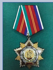
Орден Дружбы народов 1984 г.