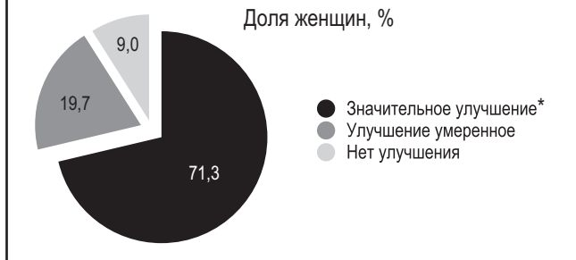
Рис. 3. Доля женщин, рассчитанная на основе шкалы самооценки опросника симптомов предменструального напряжения, у которых наступило улучшение после лечения (n=122).

Фолиевая кислота – один из важнейших кофакторов, участвующих в процессах метаболизма углерода, синтеза ДНК и др. Недостаточное ее употребление с продуктами питания помимо указанных заболеваний может быть связано с возникновением нервно-психических расстройств (аутизм и дистимия) [12, 13].