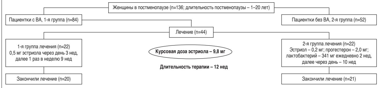
Рис. 1. Дизайн исследования: профиль набора пациенток.

С учетом патогенеза заболевания терапия эстрогенами – «золотой стандарт» лечения. Все клинические рекомендации по лечению ВВА сходятся в том, что наиболее распространенным и эффективным методом терапии является локальная гормональная терапия эстрогенами, которая обладает выраженным кольпотропным эффектом [3, 8–10]. В настоящее время в европейских странах отмечается тенденция к использованию низкодозированных локальных эстрогенов. Известно, что у большинства пациенток в период постменопаузы наблюдается дефицит лактобактерий [7, 11]. В связи с этим формирование нормальной микрофлоры – это профилактика вторичного урогенитального инфицирования женщин старшего возраста. Появление препарата, сочетающего гормоны и лактобактерии, вызывает значимый интерес специалистов и исследователей.